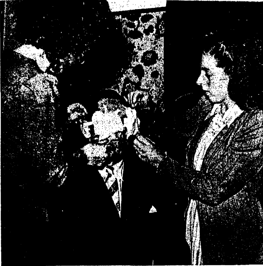
بيتر هوركوس اثناء احدى التجارب على قواه الخارقة .

لعائلة غنية ومحترمة ، ولكن في المقابل لكل هذه الأعمال التي قام بها نجد أن بعضاً من الناس العاملين بعالم البحث بالأمور الخارقة رفضوا تقبل أعمال هذا الهولندي ذو الشعر الطويل بجدية ولكن نجد من الطبيعي أن تتقبل هذه الأعمال بعد إقامته في الولايات المتحدة في عام 1958 حيث تهاقت اليه الكثير من نجوم السينما أصحاب المظهر الأنيق في هوليوود من أجل أن يكشف لهم بعض القراءات الخارقة التي لديه فعلى سبيل المثال فإن / بيتر هوركوس / ذكر حول / مارلون براندو / الممثل الشهير بأنه سوف يصبح ممثلاً جذاباً يسحر الملايين بتمثيله أما بالنسبة للممثل / غلين فورد / فإنه سيعبر عن طموحه في أن يلعب نفس دور الممثل / مارلون / على